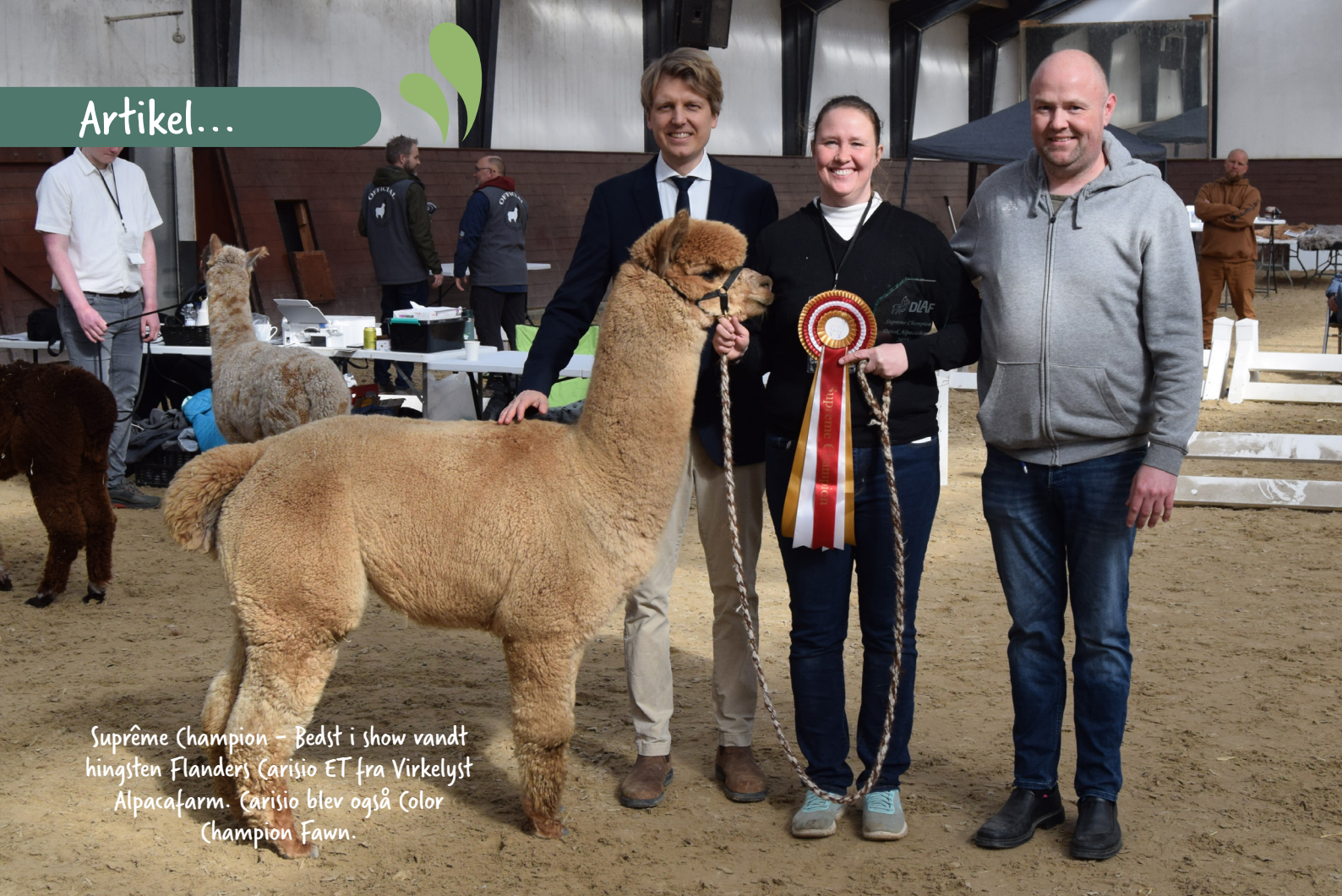
Suprême Champion – Bedst i show vandt hingsten Flanders Carisio ET fra Virkelyst Alpacafarm. Carisio blev også Color Champion Fawn.