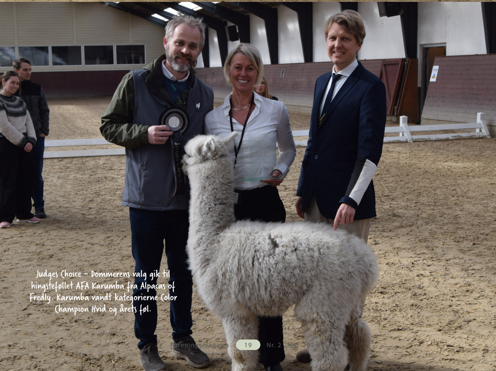
Judges Choice – Dommerens valg gik til hingsteføllet AFA Karumba fra Alpacas of Fredly. Karumba vandt kategorierne Color Champion Hvid og årets føl.